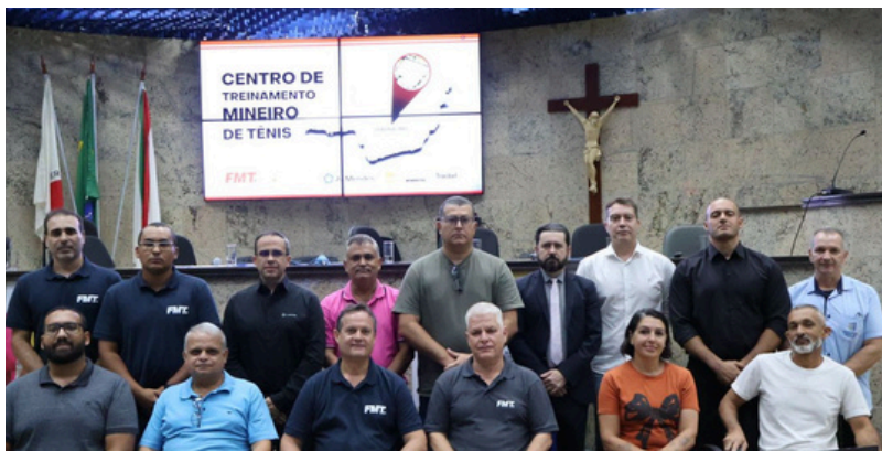
Câmara de Itaúna discute investimentos no esporte e projeto inovador da Federação Mineira de Tênis