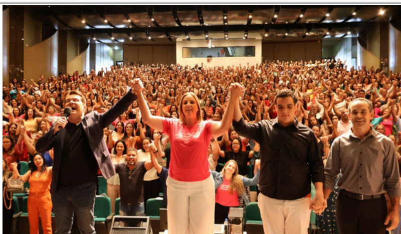
Abertura do Ano Letivo 2025 em Itaúna destaca compromisso com a educação e servidores