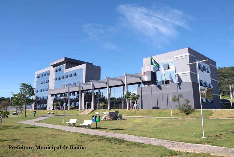
Prefeitura Municipal de Itaúna