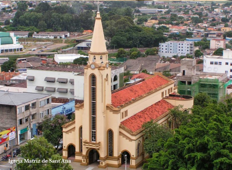
Igreja Matriz de Sant'Ana