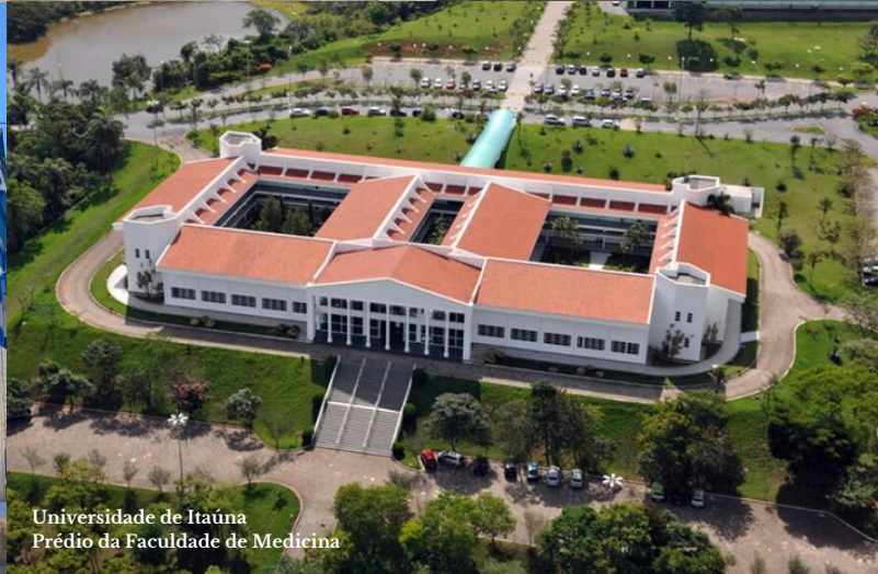
Universidade de Itaúna Prédio da Faculdade de Medicina