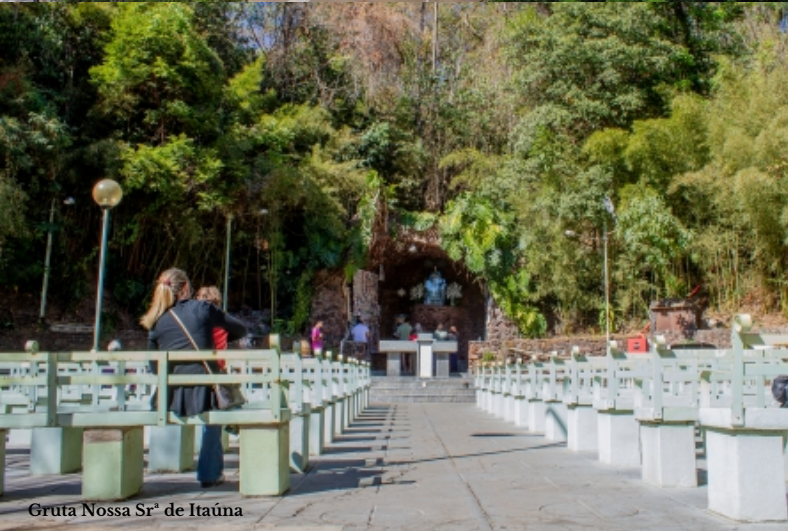
Gruta Nossa Srª de Itaúna