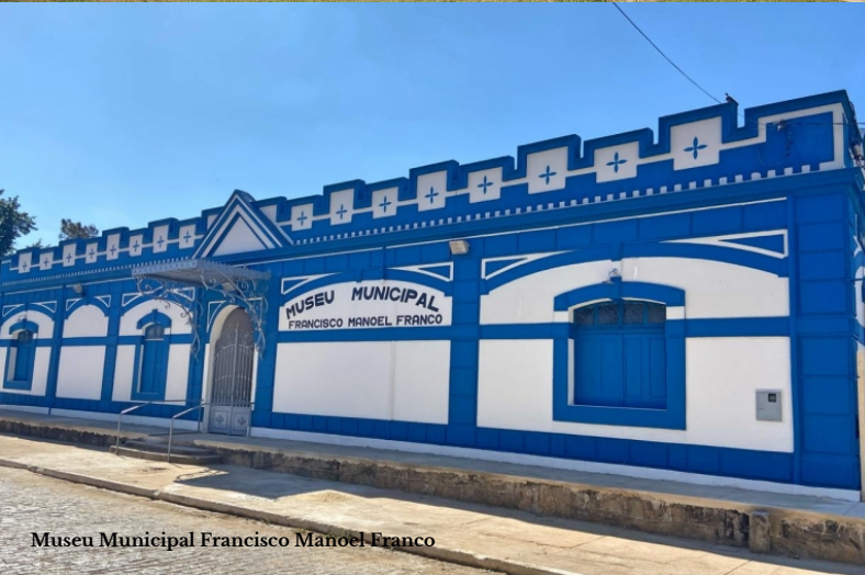
Museu Municipal Francisco Manoel Franco