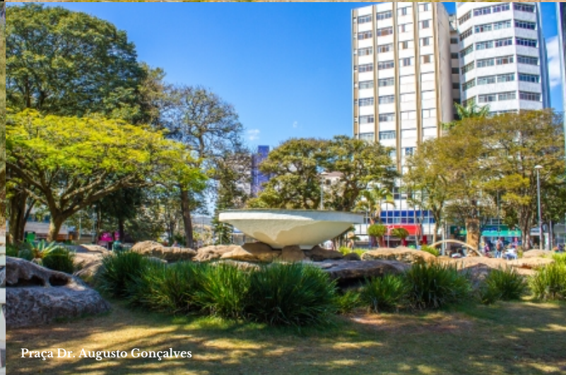
Praça Dr. Augusto Gonçalves