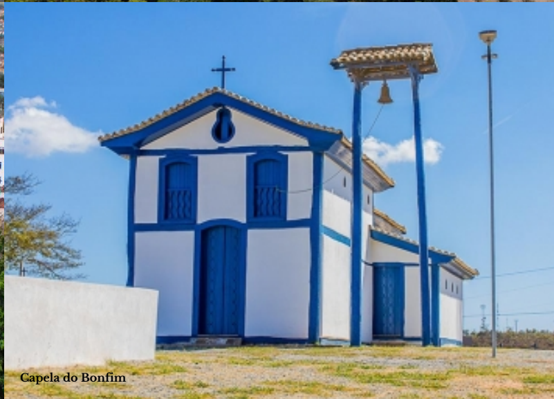
Capela do Bonfim