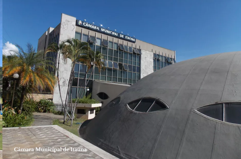
Câmara Municipal de Itaúna